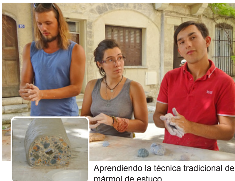
Aprendiendo la técnica tradicional del mármol de estuco.

Durante el verano, el proyecto ha entrado en una fase más práctica, involucrando a las personas jóvenes con el objetivo de entrevistar a las personas mayores con valiosas habilidades rurales. Además, el objetivo ha sido no solo motivar a los jóvenes poniéndolos en contacto con los titulares del conocimiento, sino también introducirles a las habilidades rurales que podrían brindarles oportunidades de empleo. Además, los jóvenes han ganado confianza en adquirir técnicas de entrevistas y de producción de fotos y videos. Los temas comunes abordados durante las entrevistas han sido los métodos tradicionales de albañilería, construcción en piedra seca, los conocimientos técnicos relacionados con la agricultura, como injertos, apicultura, uso de plantas medicinales y fabricación de quesos, la cocina tradicional, el encaje de bolillos, el uso del esparto y las actividades de cerámica. En algunos casos, los jóvenes no solo han entrevistado a los titulares del conocimiento (personas mayores), sino que han participado en la actividad o han observado a la persona en el puesto de trabajo.