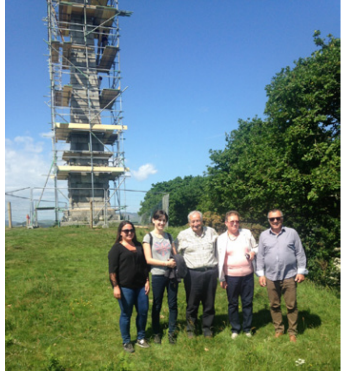
Les partenaires de Corse et de Slovaquie visitent le Rutherford Monument à Gatehouse qui est en cours de restauration.

Le projet Eco-management, savoirs d'hier, savoir-faire de demain, s'inscrit dans le cadre du programme européen Erasmus +, partenariat stratégique pour l'éducation des adultes. Il sera mené entre octobre 2017 et septembre 2019. Six partenaires se sont réunis afin de proposer un projet développant une méthodologie dont le but est d'instaurer un dialogue formalisé et pérenne entre les pouvoirs publics et des acteurs organisés de la société civile, autour de la problématique de la transmission de savoir-faire traditionnels pour un aménagement durable des territoires. La présente newsletter est la seconde élaborée dans le cadre du projet Eco-management, diffusée auprès du grand public. Deux autres suivront, afin de maintenir le public informé des avancées du projet et des temps forts organisés régulièrement.