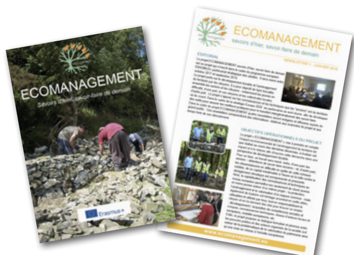
Le site web du projet, la brochure du projet et les newsletters sont produits dans les cinq langues du projet.