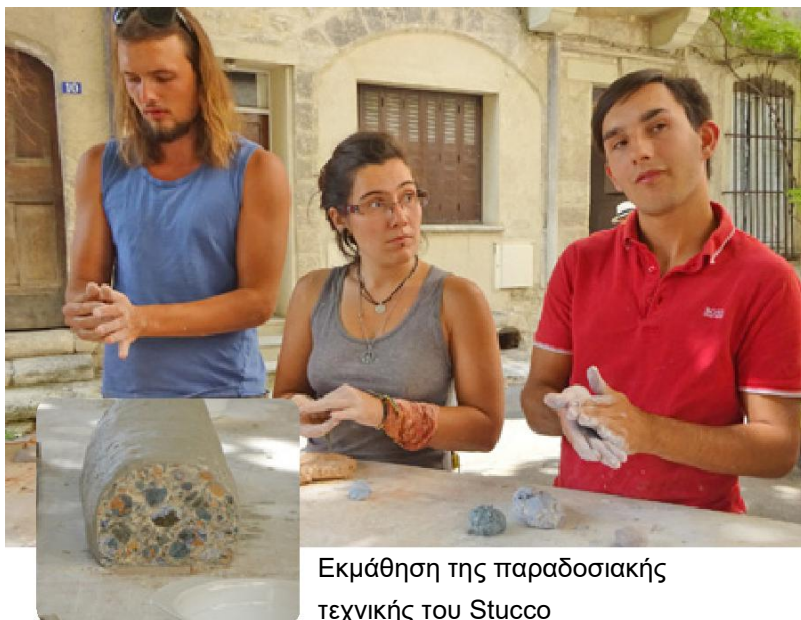
Εκμάθηση της παραδοσιακής τεχνικής του Stucco

Στη διάρκεια του καλοκαιριού το έργο μπήκε στην πιο πρακτική φάση του. Οι νέοι άρχισαν να παίρνουν συνεντεύξεις από τα ηλικιωμένα άτομα που κατέχουν πολύτιμες γνώσεις σε θέματα του αγροτικού χώρου. Ο στόχος δεν ήταν μόνο να προκληθεί το ενδιαφέρον από τους νέους μέσω της άμεσης επαφής με τους κατέχοντες τις δεξιότητες, αλλά και να τους μιήσουν σε αγροτικού χαρακτήρα δεξιότητες που θα μπορούσαν να τους προσφέρουν δυνατότητες απασχόλησης. Επιπλέον οι νέοι απέκτησαν μια εμπειρία που τους έδωσε αυτοπεποίθηση σ'ότι αφορά τις τεχνικές των συνεντεύξεων και των φωτογραφικών και βιντεοσκοπικών εγγραφών. Τα κοινά θέματα στις συνεντεύξεις ήταν οι παραδοσιακές μέθοδοι χτισίματος με ξερολιθιά και οι τεχνικές που αφορούν την γεωπονία,, εμβολιασμοί, μελισσοκομία, χρήση φαρμακευτικών βοτάνων και παρασκευή τυριών. Πολλοί εταίροι ασχολήθηκαν και με την τοπική κουζίνα. Σε κάποιες περιπτώσεις οι νέοι δεν περιορίστηκαν στις ερωτήσεις προς τους παλιούς, αλλά συμμετείχαν ή παρακολούθησαν τον παλιό τεχνίτη να εργάζεται.