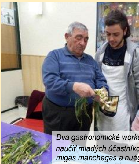
Dva gastronomické workshopy boli organizované súbežne s cieľom naučiť mladých účastníkov prípravu tradičných lokálnych pokrmov: migas manchegas a nuégados.