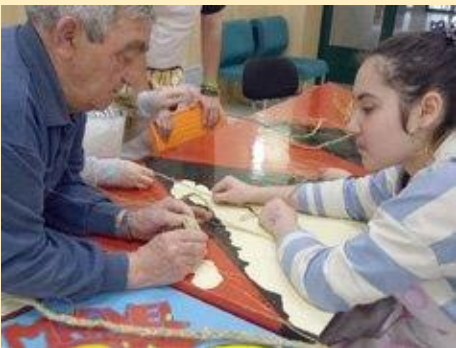
Zorganizovaný bol praktický workshop o využití konope. Mladí účastníci sa učili o konope a o spôsoboch jej využitia. Naučili sa a mohli si v praxi vyskúšať okrem iné ako sa spleťajú nite, z ktorých sa neskôr vyrábajú predmety.