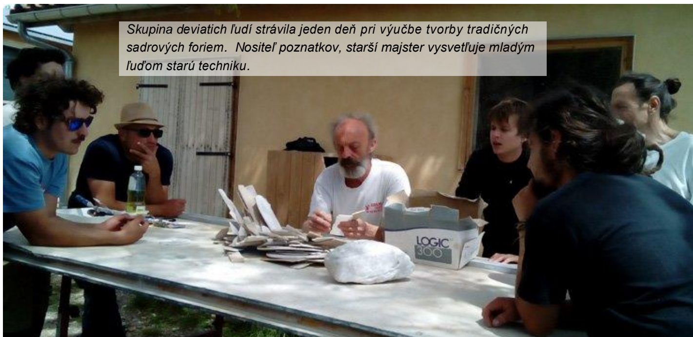
Skupina deviatich ľudí strávila jeden deň pri výučbe tvorby tradičných sadrových foriem. Nositeľ poznatkov, starší majster vysvetľuje mladým ľuďom starú techniku.