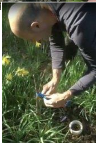
Štepenie ovocných stromov na Slovensku (hore) a v Škótsku (vľavo) a výsledok (dole).