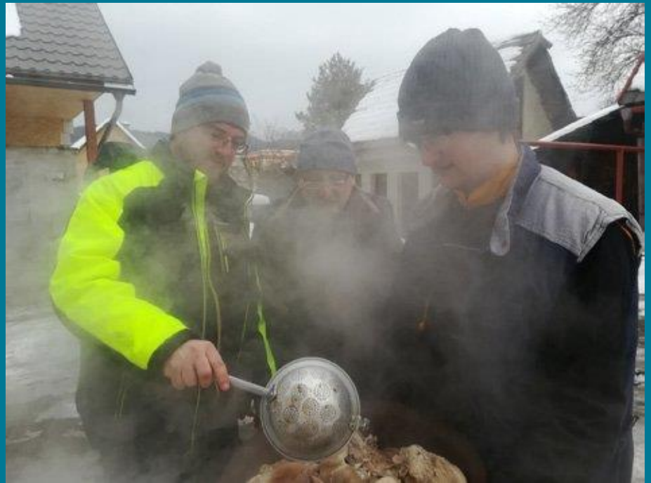
Workshop na Slovensku na tému tradičnej zabíjačky – príprava mäsa na tlačenu a spracovanie mäsa a výroba domácich klobás.